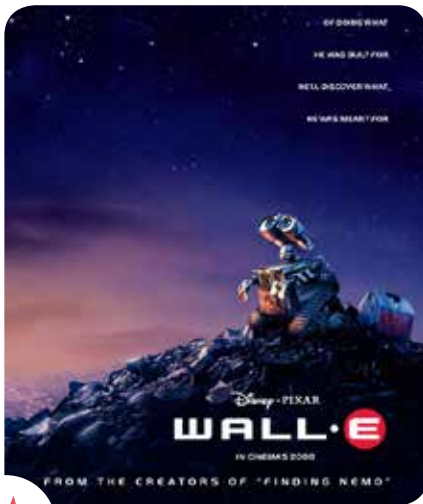
Gratis vertoning van een schitterende en verrassende komedie van Pixar Studios.

De Green Economy staat in de schijnwerpers tijdens de tweede editie van het Green Up Film Festival. Op zondag 13 oktober start het festival in het Paleis voor Schone Kunsten met een familiedag: filmvoorstellingen, creatieve workshops en tal van andere activiteiten. Thema's van de dag zijn de strijd tegen voedselverspilling en afvalvermindering. Mis het digitale gedeelte van het filmfestival niet: vanaf april 2014 is het festival te volgen op het internet, met gratis online documentaires en films over hernieuwbare energie, financiële solidariteit, zachte mobiliteit en verantwoorde consumptie. Nieuw bij deze editie is dat de internetgebruikers bepalen welke films op het festival te zien zullen zijn.